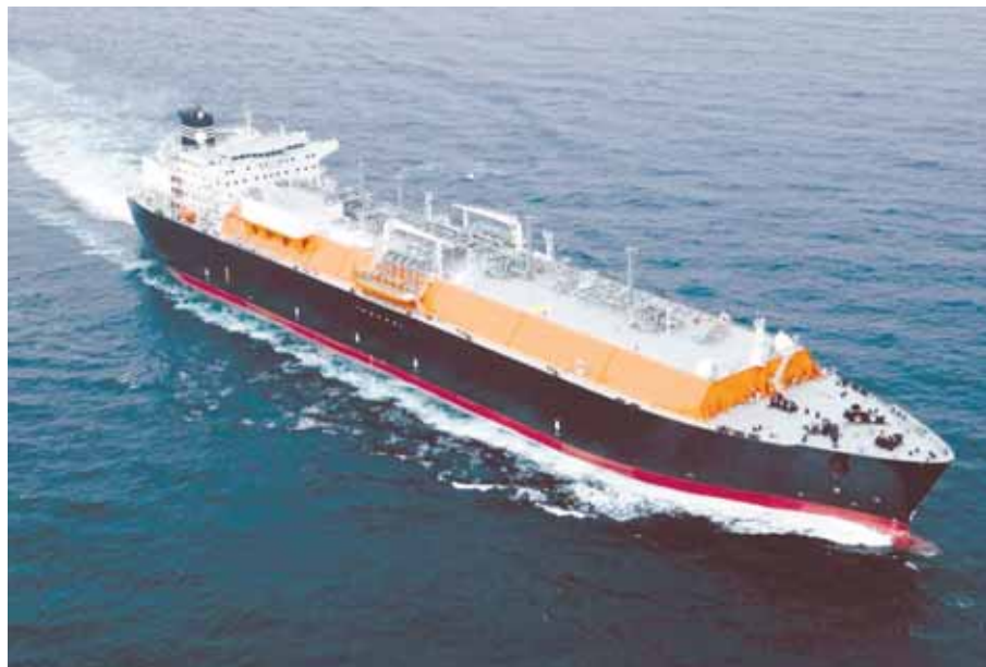
La imagen de los buques que traerán el GNL a Chile será una de las bases de la campaña.

El plan multimedial, cuyo desarrollo comenzó a fines del año pasado y debutará en paralelo con la inauguración del terminal de Quintero, fue concebido en conjunto con las agencias Prolam Y&R, Armstrong y Asociados y Edwards y Asociados. Contó