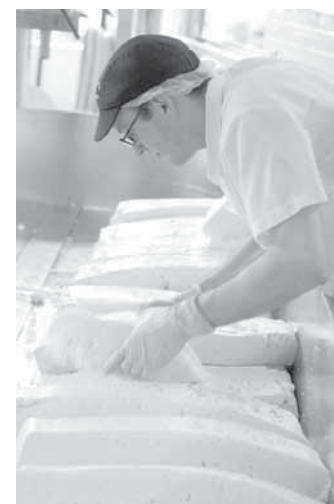
La entidad pretende fortalecer la competitividad de las empresas.

AE inició sus operaciones en 2002 y gracias a recursos que el Fondo Multilateral de Inversiones