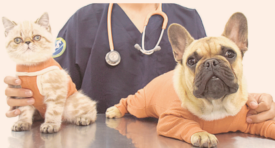
Body postquirúrgico para perros y gatos, con tela compuesta por micropartículas de cobre y zinc.