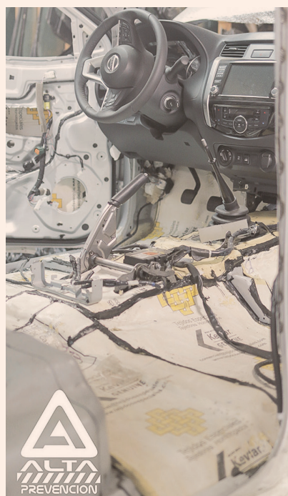
Automóvil blindado con Kevlar.