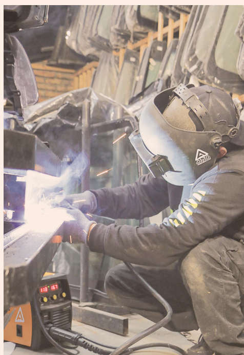
Blindaje de pickup de vehículo.