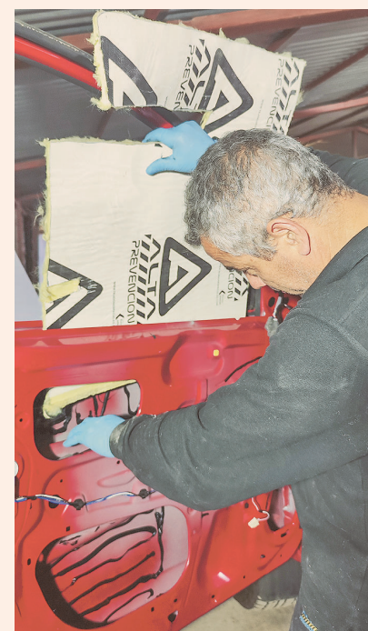
Instalación de Kevlar, un polímero de gran resistencia.

En ese marco, los atributos más distintivos del servicio de Alta Prevención son los siguientes: