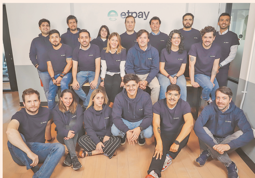
El equipo de ETpay destaca por su excelencia y espíritu innovador. En la imagen, parte de los colaboradores de la empresa.