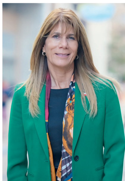
Ministra de Energía, Ximena Rincón.

En abril de 2018 se realizó la primera recaudación del Impuesto Verde y su sistema de compensaciones, vigente desde 2023, el que ha propiciado la reducción de cerca de 6,4 millones de toneladas de CO 2 a la fecha. En esa misma línea, se han autorizado proyectos y programas de actividades vinculadas a reconversión de procesos térmicos, electromovilidad y almacenamiento de energía, bajo el Artículo 6